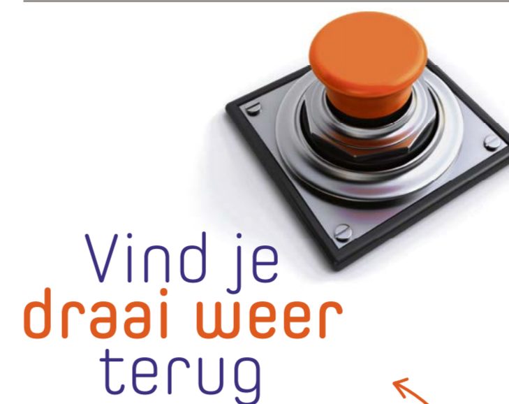
Henk de Bruin