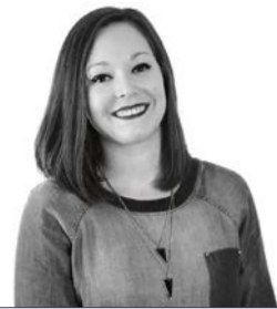
Tanita team Communicatie